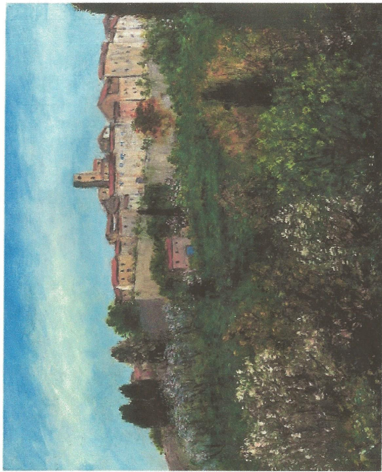
Saint-Paul de Vence par Jacques Michel Dunoyer